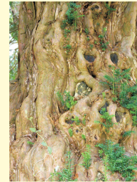
Detalle do toro dun teixo

Todas as partes do teixo son velenosas agás o arilo que recobre a semente. Contén un alcaloide, a taxina, que produce a morte en pouco tempo. Foi empregado en medicina tradicional como abortivo. Segundo conta a lenda os galaicos do Monte Medulio envelenáronse cunha beberaxe feita con froitos de teixo para non ter que rendirse aos romanos.